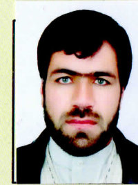
مرستیال / V-President