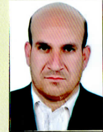
رئیس / President